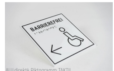
ALU.direkt4 Piktogramm TAKTIL